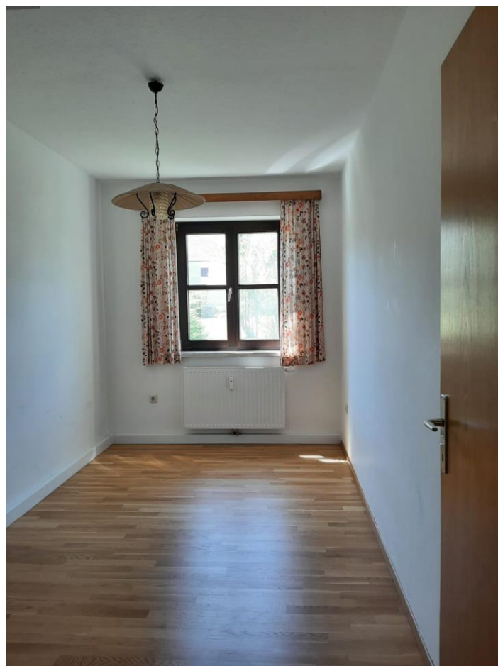
Arbeitszimmer oder kleines Schlafzimmer